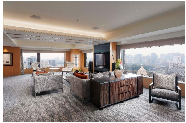
特別イベントを開催する「ザ・キャピトル スイート」