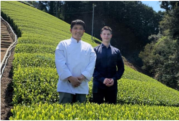
静岡県駿河区「松川茶園」